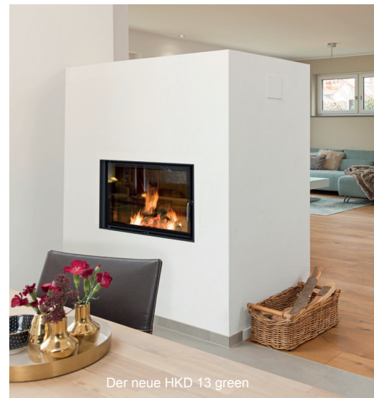
Der neue HKD 13 green

die Holzheizkamine lassen sich jederzeit nachrüsten und mittels Katalysator und elektronischer Abbrandsteuerung (EAS) aufs nächste Level „green+“ heben. Allein der Katalysator reduziert die CO-Emissionen nachweislich um 80 Prozent und Kohlenwasserstoffe um 50 Prozent, während die EAS die perfekte Verbindung aus Komfort und Umweltfreundlichkeit ist. Sie steuert und optimiert die Verbrennungsluftzufuhr was in Folge weniger Holzverbrauch und ebenfalls weniger Emissionen bedeutet.