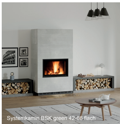
Systemkamin BSK green 42-66 flach

Auch wenn sich gesetzliche Emissionsvorschriften weiter verschärfen sollten, mit den BKH green Kaminen sind Sie auf der sicheren Seite, denn